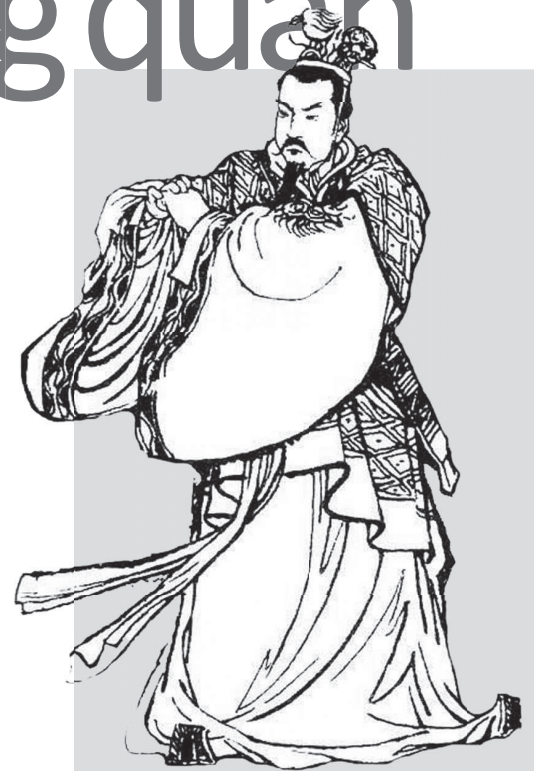
Mạnh Thường quân.

toàn trục lợi, trực tiếp hoặc gián tiếp qua những chứng nhân cò mối. Mỹ từ nhà quảng cáo bảo trợ luôn luôn bị gian thương lợi dụng để quảng cáo láo khoét. Lắm khi họ không ngần ngại dùng những ngôn từ, những nội dung mạnh tay đến nỗi người dẫn thông tin của họ đến quăng đại quần chúng phải thận trọng lên tiếng trước rằng mình hoàn toàn không chịu trách nhiệm về những thông tin các nhà quảng cáo bảo trợ sở hữu! Nhất là trong lãnh vực y dược, đa số những thông tin này chưa bao giờ được những phòng thí nghiệm khả tín hoặc những cơ quan có thẩm quyền kiểm nhận, ngay cả sách vở, tài liệu giáo khoa, khoa học còn chưa có! ( Chi tiết xin trao đổi trực tiếp Debra Ken Faulk 813-258. 2599 thành phố Tampa, tiểu bang Florida, USA hoặc vào