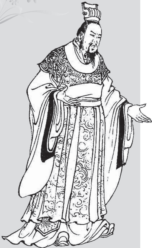
Bình Nguyên quân.

► ngộ như thế Điền Anh chợt tỉnh ra rất lấy làm hối hận, mến phục, liền cho người dưỡng dục đặc biệt. Lên mười tuổi Điền Văn bắt đầu biết giao tế với mọi người được ai ai cũng yêu quý. Các tân khách trong cung như ngoài nước Tề đều mong có dịp tiếp xúc Điền Văn. Từ đó và cũng từ đó Tể tướng Điền Anh rất quý trọng Điền Văn, chọn Ông làm con đích tôn nối dõi nhà họ Điền và gọi Điền Văn bằng Mạnh Thường quân; xem con như một quan chức ở đất Mạnh Thường nơi mình đang cư ngụ.