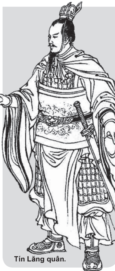
Tín Lăng quân.

iv/ Xuân Thân quân tên thật là Hoàng Yết người nước Sở không có đạo sư.