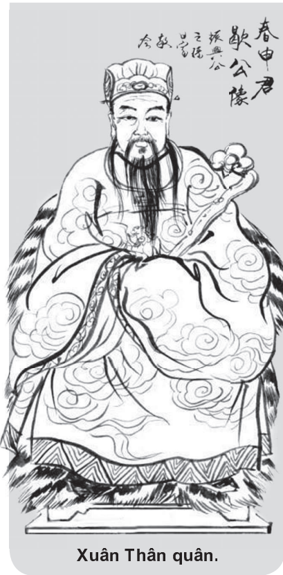
Xuân Thân quân.

Thực khách một ngày một đông, kho lương thực một ngày một vơi. Mạnh Thường quân nghĩ đến việc phải bù đắp vào chỗ thiếu hụt bền ngỡ ý cần người giúp mình đi đòi nợ dân đất Tiết (có sách gọi là ấp Tiết) nay thuộc miền nam tỉnh Sơn Đông nước Tàu. Biết trước công việc rất nhiều khê không dễ gì thành tựu đa số thực khách tìm cách khéo léo chối từ. Riêng Phùng Hoan cho rằng cơ hội mình chờ mong nay đã